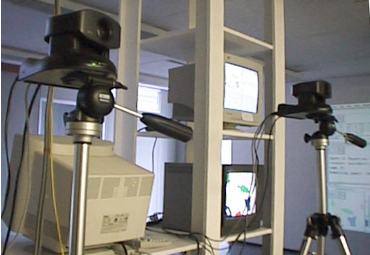
Figure 1: Dans chaque site, deux caméras mobiles sont placées devant un tableau blanc (Site d'Anvers - Première phase de l'expérience)

L'installation du Palais de la Découverte fait partie d'un réseau de plates-formes robotiques situées dans d'autres expositions (Exposition N01SE à Londres et à Cambridge) et dans des laboratoires de recherche (Sony CSL Paris, VUB AI Lab Bruxelles). Ces plates-formes sont reliées les unes aux autres par Internet. Un agent, chargé dans le corps "physique" d'une "Tête Parlante", peut se téléporter dans un autre système de "Têtes Parlantes". Ainsi il peut découvrir de nouveaux environnements.